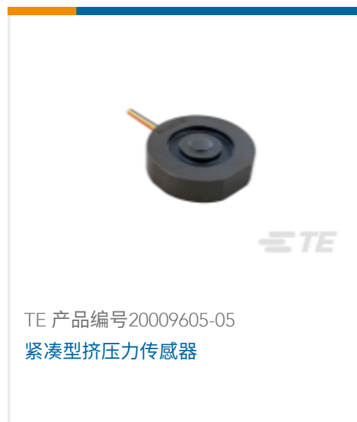
TE 产品编号20009605-05 紧凑型挤压力传感器