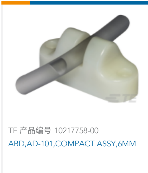
TE 产品编号 10217758-00 ABD,AD-101,COMPACT ASSY,6MM