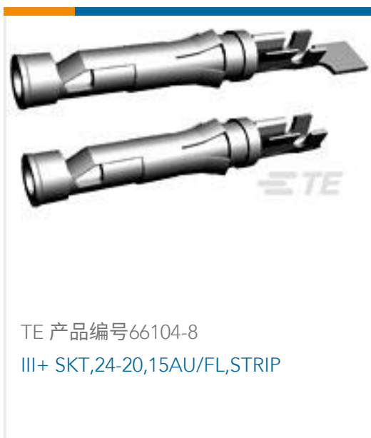
TE 产品编号66104-8 III+ SKT,24-20,15AU/FL,STRIP