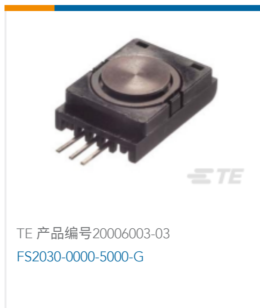
TE 产品编号20006003-03 FS2030-0000-5000-G