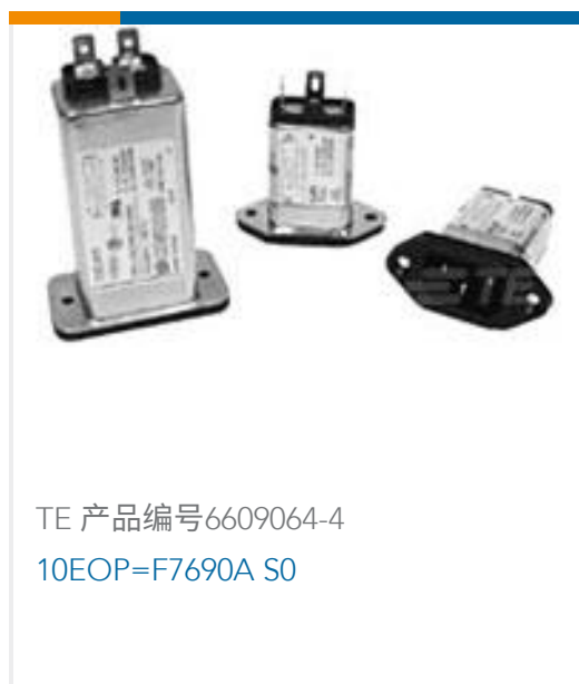
TE 产品编号6609064-4 10EOP=F7690A S0